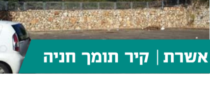
אשרת | קיר תומך חניה