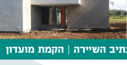
נתיב השיירה | הקמת מועדון