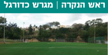
ראש הנקרה | מגרש כדורגל