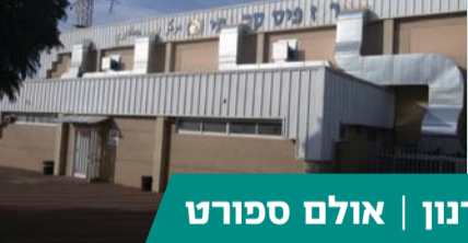
שיח' דנון | אולם ספורט