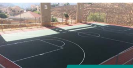
ערמשה | מגרש כדורסל