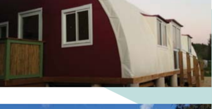
כליל | מועדון נוער